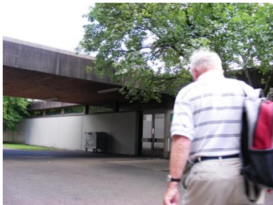
Vor uns liegt der Eingang zu den Turnhallen