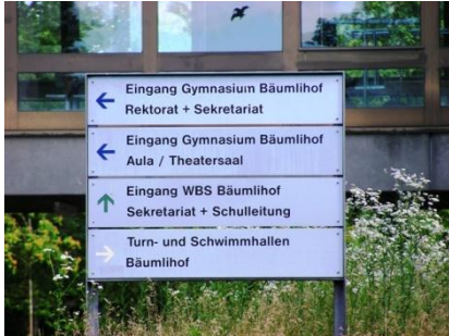
Infotafel befindet sich über der Tiefgarage