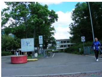
Eingang zum Schulkomplex