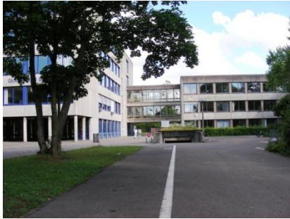
Vor Tiefgarage , rechtshalten