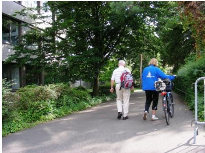
Weg nach hinten zu den Turnhallen nehmen.